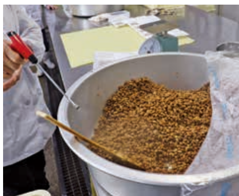
納豆菌を振りかける