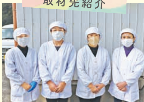
勝本地区納豆生産組合の皆さん

年間7トンから7.5トンの納豆を製造する勝本地区納豆生産組合は、約40年前に組合が発足。