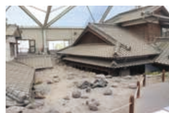
▲土石流家屋保存公園